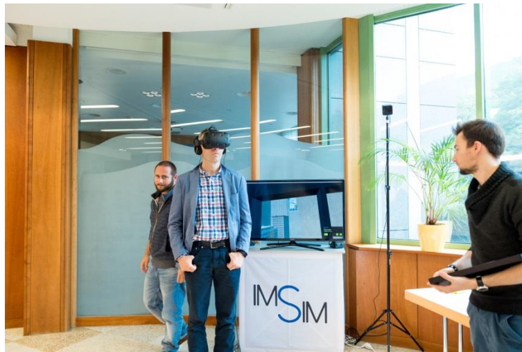
Demo Stand IMSIM