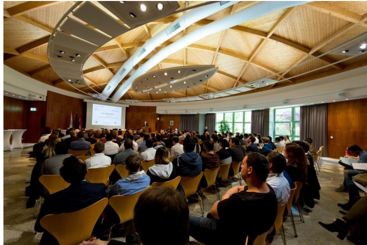
Reges Interesse von Seiten der Betriebe und Experten

Die Veranstaltung wurde organisiert von der Chambre des Métiers, dem Interregionalen Rat der Handwerkskammern der Großregion (IRH), dem Kompetenzzentrum Digitales Handwerk Koblenz, Luxinnovation in Zusammenarbeit mit dem Luxemburger Vorsitz des Gipfels der Großregion, dem Wirtschafts- und Sozialausschuss der Großregion (WSAGR) sowie Digital Lëtzebuerg.