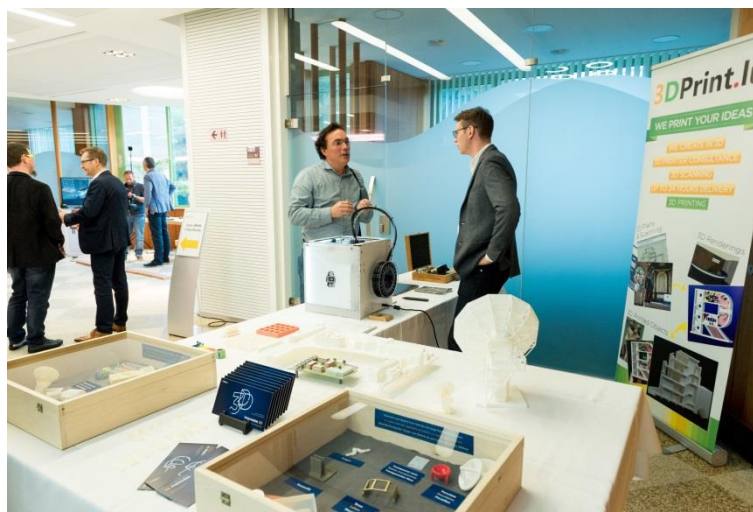
Demo Stand 3D PRINT